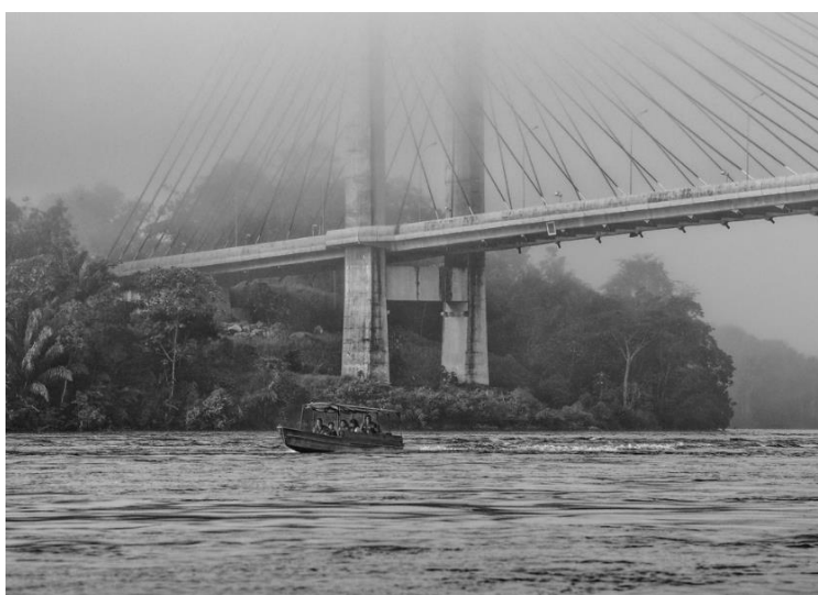
Pont sur l'Oyapock (Guyane) à la frontière franco-brésilienne.