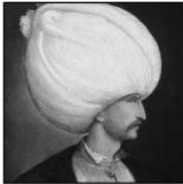
Soliman le Magnifique